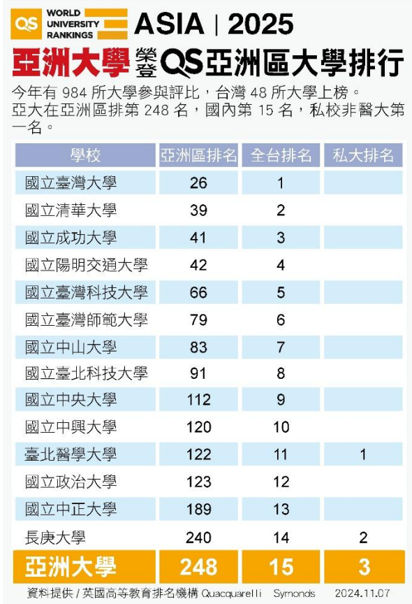
圖：英國 QS「2025 亞洲最佳大學」排名，亞大名列全台私大第 3 名、非醫科私大第 1 名